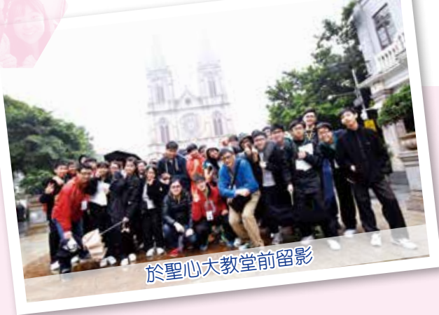
於聖心大教堂前留影

過往三年，本校中三級全級同學參加由教育局舉辦之「同根同心 -- 中學生內地交流計劃」，行程包括參訪當地西式及中式建築，讓同學了解廣州的文物保育工作，並認識中國近代的重要歷史人物和歷史事件。另外，同學亦參觀了當地的外資及民營企業，了解中港兩地經濟合作的模式與前景；同學亦參觀當地中學，讓兩地學生可作交流，認識兩地學習模式的特色。