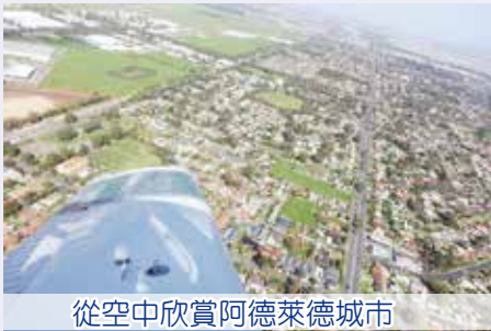
從空中欣賞阿德萊德城市