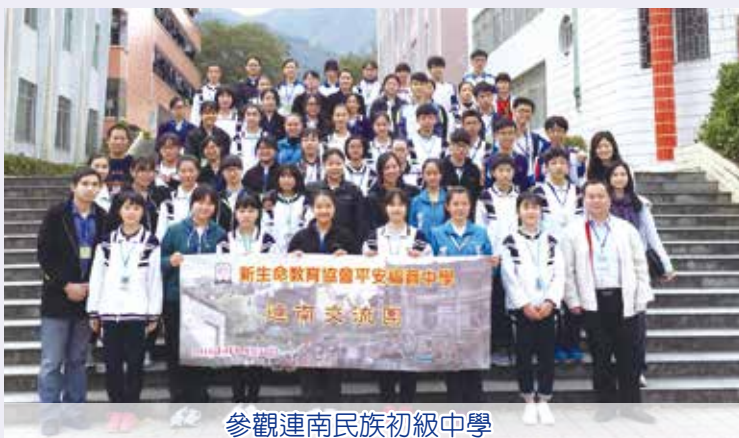
參觀連南民族初級中學