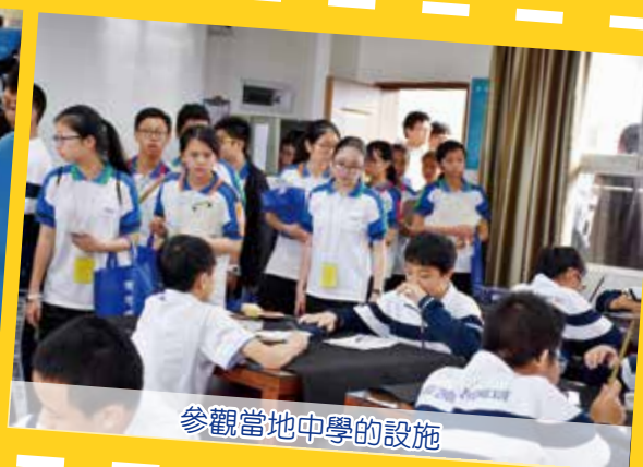
參觀當地中學的設施