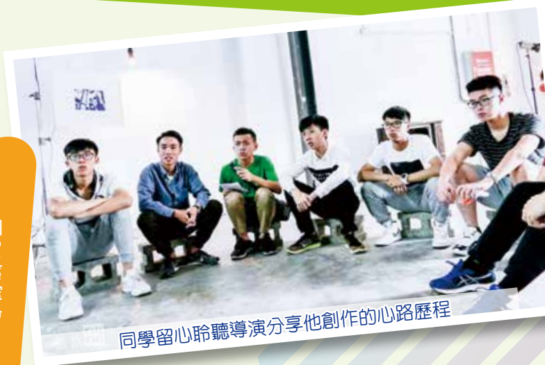
同學留心聆聽導演分享他創作的心路歷程

我有幸到台灣的總統府參觀到第二個展區。忽然展區猛烈搖晃，像很多個巨人在跑步，原來發生高達 4 級的地震，這是我第一次遇到地震。想不到遊學團讓我體會到平日不會接觸到事物，更使我和同學們間的感情增進一大步。