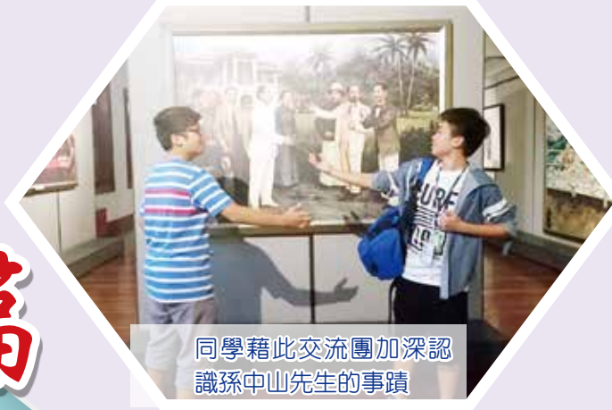
同學藉此交流團加深認識孫中山先生的事蹟