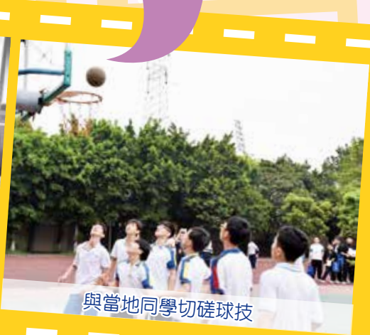
與當地同學切磋球技