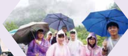
雨中的張家界還是很美