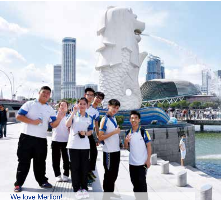
We love Merlion!