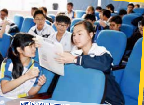
兩地學生互相分享和討論