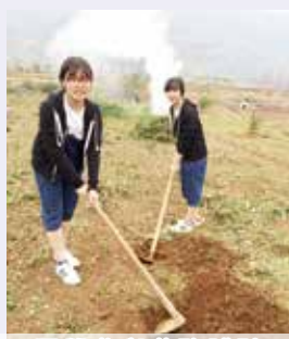
同學參與農務體驗