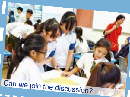
Can we join the discussion?