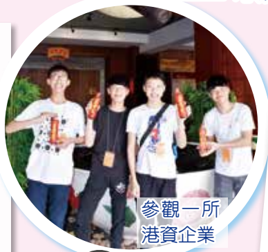
參觀一所 港資企業