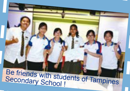
Be friends with students of Tampines Secondary School!