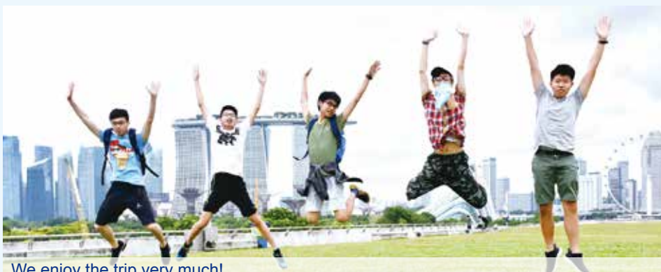
We enjoy the trip very much!

It's my pleasure and honour that I had a chance to visit Singapore. I think our trip was really fantastic. We visited different landmarks. We saw a lot of spectacular buildings while travelling by a tour bus. There are quite a lot of eco-friendly buildings with great design. In addition, I appreciate that the effort of the Singaporean Government in building the country. The land use policy is impressive. They use the land well with the combination of old and new designs, different zones of social classes and industrial versus green belts. However, the most stunning was that I could hardly see a garbage bin, or litter on the ground. The air is exceptionally fresh. I think that Singaporean people are resourceful, thoughtful and health - conscious!