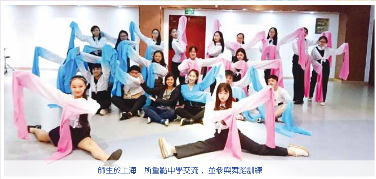
師生於上海一所重點中學交流，並參與舞蹈訓練