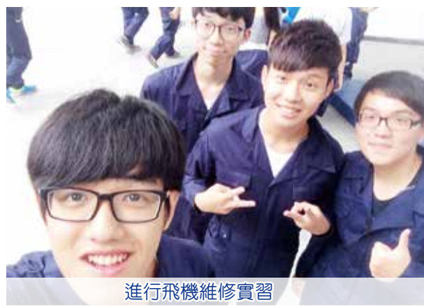
進行飛機維修實習

本校開設了應用學習課程：航空學（服務）供有興趣投身航空業的學生報讀，中六學生修讀完畢後，可參加由教育局舉辦的職場體驗計劃，為他們提供額外的職場體驗學習機會。整個課程穿梭香港、澳門、珠海及廣州四地，由航空業界富經驗人士帶領學生進行活動，包括安全操作實習、飛機維修實習、航空服務實習和模擬飛行工作坊等。學生從中可更了解航空業的職場要求和行業發展，對他們甚有裨益。