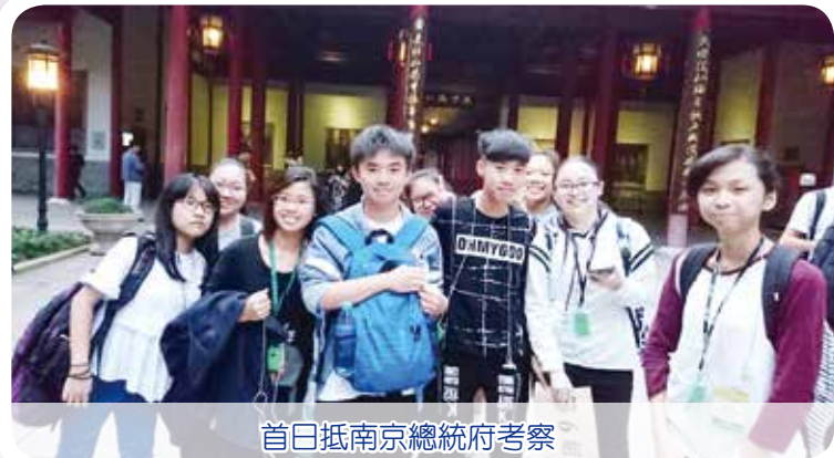
首日抵南京總統府考察

為促進學生認識祖國及配合課程，本校於2016年參加了教育局舉辦的「紀念孫中山先生誕辰150周年內地交流計劃」，讓學生透過跟隨孫中山先生在南京和上海的足跡，認識孫中山先生的生平事蹟及相關的歷史事件，並了解孫中山先生對歷史發展的貢獻；同時透過參訪內地院校，認識內地學生的學習生活和升學情況。