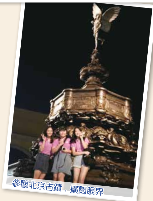
參觀北京古蹟，擴闊眼界

最令我印象深刻的參加天安門廣場升旗禮。那天我們凌晨三點就出發，在路途中，外面漆黑一片，大家都累得在車上睡覺。到了天安門外，大家都在安靜等待儀式開始。整個升旗禮十分莊嚴，也增加了我對中國的認識和身份認同感。升旗儀式後，我們就慢慢散步回到集合點。回到香港後，我仍然會回味旅程中不同的點滴回憶！