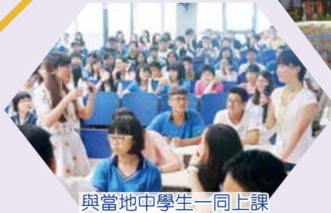
與當地中學生一同上課