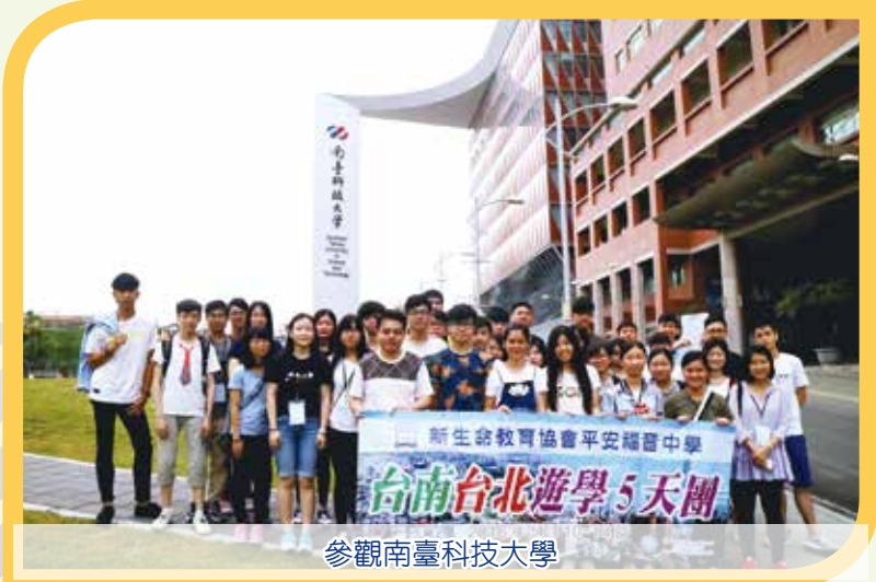
參觀南臺科技大學