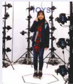
3D 人型立體模型拍攝體驗