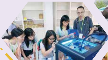
參觀大學 3D 打印技術