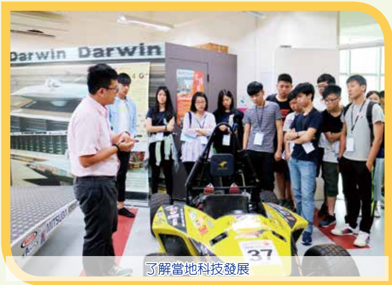
了解當地科技發展