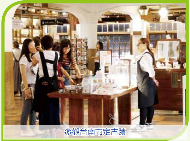
參觀台南市定古蹟