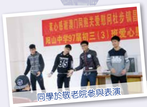
同學於敬老院參與表演