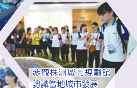
參觀株洲城市規劃館 認識當地城市發展