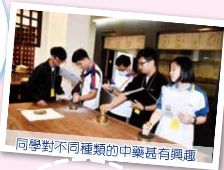
同學對不同種類的中藥甚有興趣