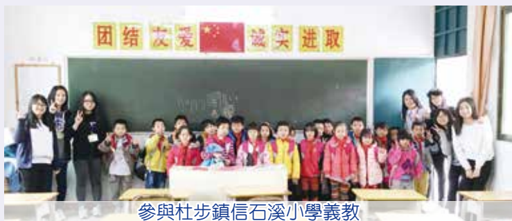
參與杜步鎮信石溪小學義教

學校希望藉是次內地連南交流團，透過不同的參觀，提升學生對內地的認識，了解當地人的需要，懂得珍惜自己所擁有的一切；另外，亦藉服務當地人士，讓學生學習欣賞、接納、感恩，明白自己亦能貢獻自己的力量，回饋社會。