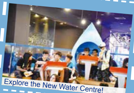
Explore the New Water Centre!